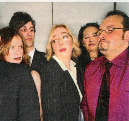
Überfüllter Fahrstuhl: Angesichts der eigenen Wut am liebsten im Erdboden versunken

angemessen reagierten. Nicht alle jedoch fahren so häufig aus der Haut, wie dies der Chemikerin früher passierte. Obwohl fachlich anerkannt, eckte sie immer wieder bei Kollegen an, stritt an der Supermarktkasse mit langsamen Kassiererinnen oder im Hausflur mit den Nachbarn über bellende Hunde. Immer wieder fühlte sie sich provoziert, selbst von ihrem siebenjährigen Sohn, wenn der